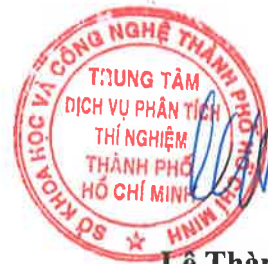
Lê Thành Thọ

1/ KẾT QUẢ NÀY CHỈ CÓ GIÁ TRỊ TRÊN MẪU THỬ/ THIS RESULT IS ONLY VALID ON TESTED SAMPLE. 2/ Thông tin về mẫu được ghi theo yêu cầu của khách hàng/ The sample information is written as customer's request. 3/ Không được sao chép toàn bộ hoặc một phần kết quả này dưới bất kỳ hình thức nào nếu không được sự đồng ý bằng văn bản của CASE/ No fully or partial of this result may be reproduced in any form without prior permission in writing from CASE.