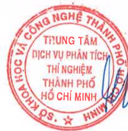
Lê Thành Thọ

1/ KẾT QUẢ NÀY CHỈ CÓ GIÁ TRỊ TRÊN MẪU THỬ/ THIS RESULT IS ONLY VALID ON TESTED SAMPLE. 2/ Thông tin về mẫu được ghi theo yêu cầu của khách hàng/ The sample information is written as customer's request. 3/ Không được sao chép toàn bộ hoặc một phần kết quả này dưới bất kỳ hình thức nào nếu không được sự đồng ý bằng văn bản của CASE/ No fully or partial of this result may be reproduced in any form without prior permission in writing from CASE.